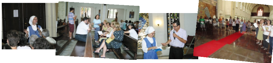
Ver mais fotos do Acolitato e da Assembleia no site da Paróquia www.cristoredentor-rj.com.br

A VIDA É UM DOM A SER PARTILHADO UMA SIMPLES ORAÇÃO Deus, Pai de amor, que tudo